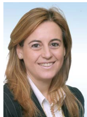
Autor: Isabel Casares San José-Martí Economista y Actuario de Seguros

Dentro de proceso de implementación de la gestión y control de riesgos de las empresas y tras la identificación y evaluación de los riesgos, el equipo de dirección de la empresa debe determinar la eficacia y eficiencia de los controles y analizar la respuesta al riesgo propuesta inicialmente, de tal forma que los nuevos resultados obtenidos no lleven modificaciones en las propias definiciones de la estrategia.